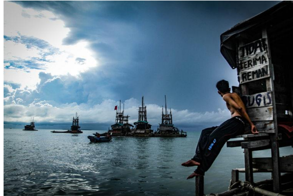
Gambar 2. Timah laut di perairan pulau bangka

Penguasaan lahan pesisir sering kali menimbulkan konflik kepentingan antara berbagai pihak, seperti masyarakat lokal, pemerintah, dan sektor swasta. Konflik ini terjadi karena sumber daya pesisir memiliki nilai ekonomi tinggi dan sering dianggap sebagai "open access," yang berarti siapapun bisa menggunakannya. Pemerintah memiliki peran penting sebagai regulator dan fasilitator untuk menjembatani konflik ini, terutama dalam perencanaan zonasi wilayah pesisir. Contohnya, di Bangka Belitung, konflik terjadi antara eksploitasi timah dan upaya melindungi ekosistem pesisir