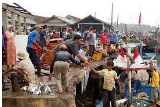
Gambar 1. Sosiologi masyarakat pesisir

Selain itu, privatisasi lahan pesisir sering kali memperburuk ketimpangan ekonomi. Campling dan Colás (2018) dalam artikel mereka tentang kapitalisme dan laut, menjelaskan bagaimana privatisasi sumber daya laut dan pesisir sering kali memberikan keuntungan besar kepada investor asing atau nasional yang memiliki akses modal besar. Sementara itu, masyarakat lokal hanya mendapatkan sedikit manfaat dari proses ini, bahkan sering kali justru tersingkir. Hal ini menyebabkan ketimpangan ekonomi yang semakin besar, di mana masyarakat lokal menjadi semakin rentan secara ekonomi, sementara pemilik modal besar menikmati keuntungan dari pengembangan lahan pesisir yang mereka kuasai. Ketimpangan ini tidak hanya terlihat dalam distribusi pendapatan, tetapi juga dalam kepemilikan tanah, akses terhadap peluang ekonomi, dan keterlibatan dalam pengambilan keputusan terkait pengelolaan lahan pesisir.