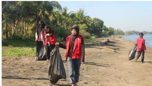
Gambar 5. Konservasi perlindungan ekosistem

Rencana Mitigasi Mengembangkan strategi untuk mengurangi atau mengeliminasi risiko lingkungan, termasuk pencegahan polusi dan pengelolaan limbah. Kebijakan dan Prosedur: Membuat kebijakan dan prosedur untuk mematuhi regulasi lingkungan dan standar industri.