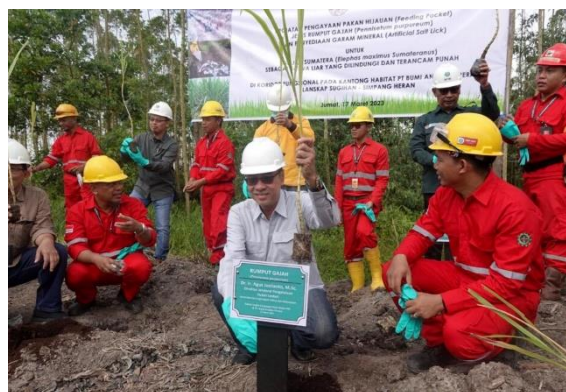
Gambar 4. Konservasi perlindungan ekosistem

Mengelola dampak dari perubahan iklim dan bencana alam seperti banjir, gelombang pasang, dan kenaikan permukaan laut. Ini termasuk pembangunan infrastruktur yang tahan bencana serta perlindungan ekosistem seperti mangrove yang berfungsi sebagai penahan alami dari tsunami dan badai.